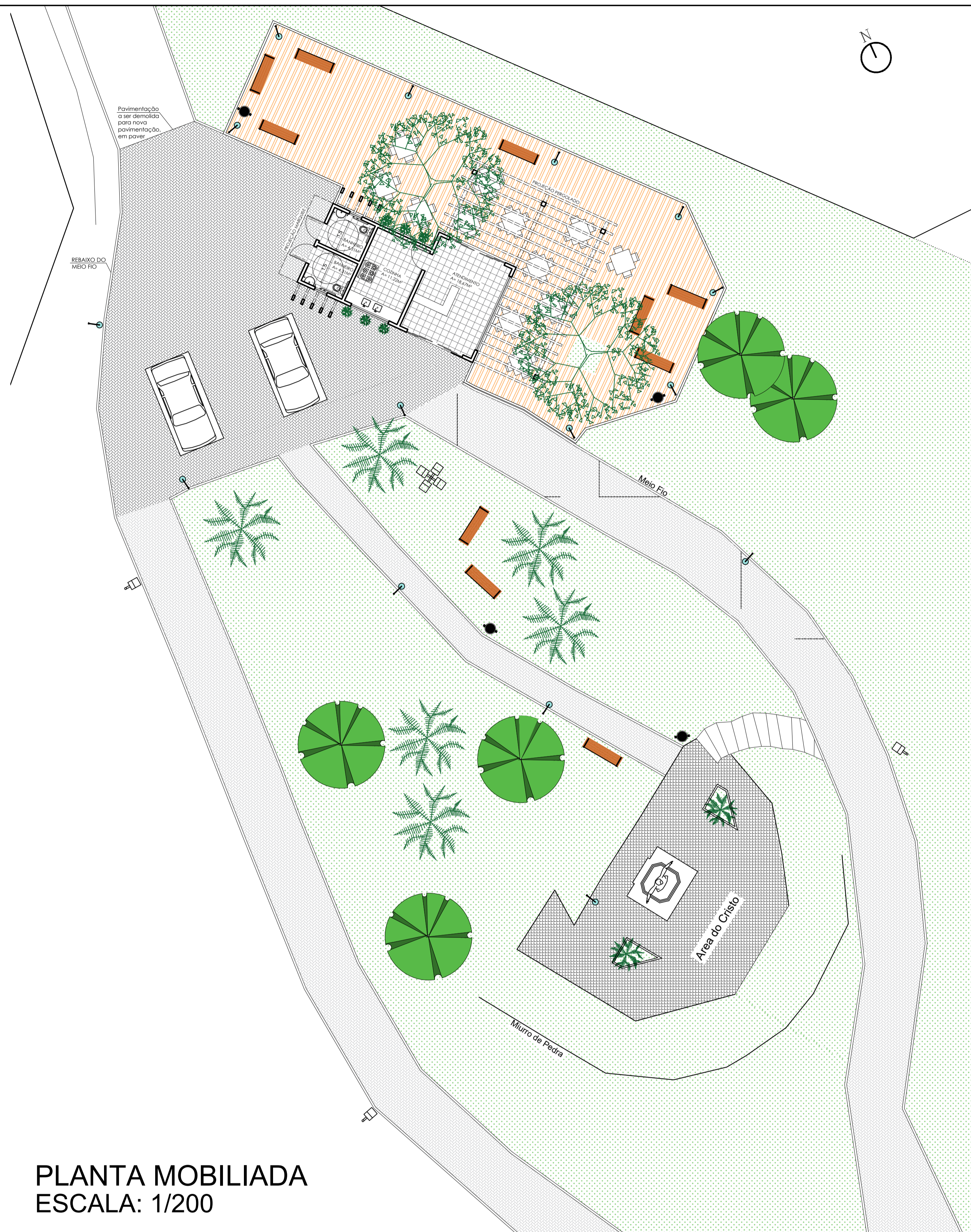
PLANTA MOBILIADA ESCALA: 1/200