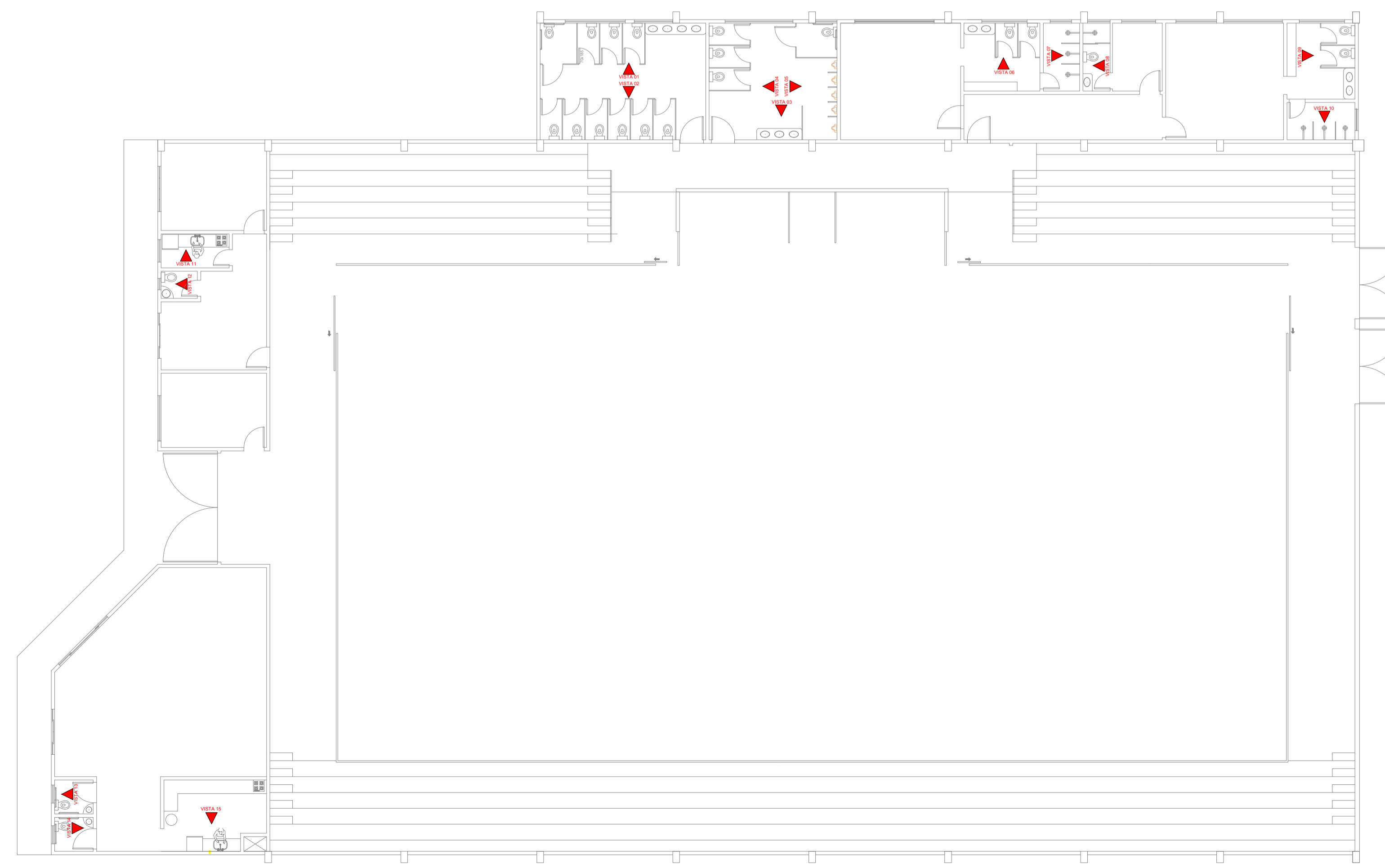
PLANTA BAIXA INDICATIVA DE VISTAS ESCALA: 1/150